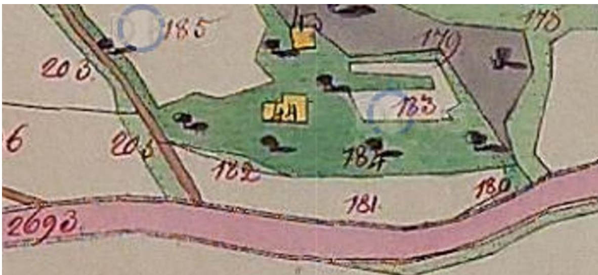
Urmappe aus 1824

Errichtet wurde das Haus als ebenerdiger Bau ohne Obergeschoß auf einem Steinfundament. Die Zwischenwände bestanden überwiegend an den Enden aus Kanthölzern, dazwischen waren Äste bzw. Astgabeln eingestellt die mit einem Lehm-Stroh-Gemisch verputzt waren.