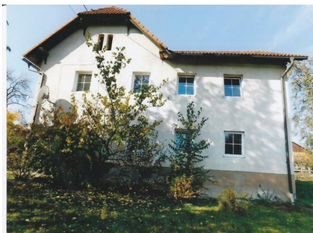
Das „Lindner-Häusl“ in seinen Seitenansichten

Seit 2018 keine Mieter /Bewohner mehr im „Lindner-Häusl“ und 2019 zum Abbruch vorgesehen.